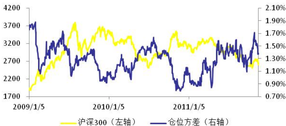
图1：仓位方差和沪深300对比走势图

我们采用市场基金持仓方差来度量各基金之间的持仓差异。市场基金持仓方差越大，说明各基金对后市看法分歧越大；反之，则说明各基金对后市看法较为一致。