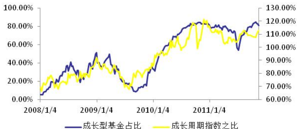
图 2：成长型风格基金占比下降

本周，成长型风格基金占比连续第三周小幅下降。截至 11 月 18 日，成长型风格基金数量占股票类基金数量的 81.09%。最近一段时间，基金风格和市场风格出现了一定程度的背离，成长型风格基金占比连续三周小幅下降，而市场上成长股的表现却持续好于周期股。我们认为，这一背离是暂时的，由于目前成长型风格基金占比仍处于一个历史比较高的水平，未来成长股的风险将会高于周期股，在市场不佳的情况下，跌幅可能会相对较大。